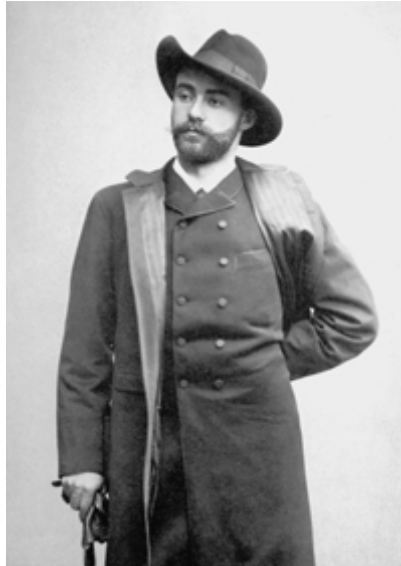
Sudermann um 1885

Hermann Sudermann zählt zu den bekanntesten Schriftstellern Ostpreußens. Aus ärmlichen Verhältnissen stammend, zog es ihn schon früh in das kulturelle Zentrum Berlin, wo er als Dramatiker und Romancier Ende der 1880er Jahre reüssierte. In der Folgezeit gestaltete er das kulturelle Leben der Metropole nicht nur literarisch, sondern auch mit streitbarem politischem Einsatz entscheidend mit. Seine Werke trafen den Geschmack des wilhelminischen Publikums; Sudermann galt als einer arriviertesten Schriftsteller seiner Zeit. Erst nach der Jahrhundertwende begann seine Beliebtheit nachzulassen, was nicht zuletzt mit dem heftigen Disput zusammenhing, den er sich mit Alfred Kerr und anderen Kritikern über Usancen der Theaterkritik lieferte. Obwohl es stiller um ihn wurde, blieb er weiterhin sehr produktiv und verfasste u.a. den Erzählband „Litauische Geschichten“, die ihm als einem der großen Erzähler einen Platz in der deutschen Literaturgeschichte sichern.