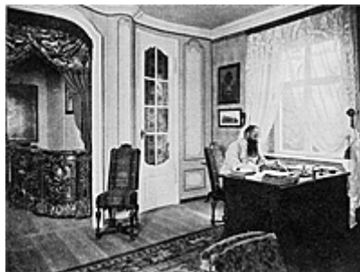
Hermann Sudermann an seinem Schreibtisch in Schloss Blankensee

Besuch des Realgymnasium in Tilsit, Abitur 8.3. 1875 .