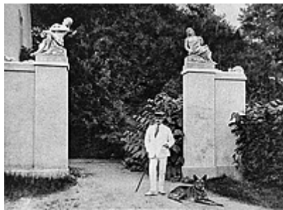
Hermann Sudermann am Parktor von Schloss Blankensee

1902 reagiert S. mit der Streitschrift „Verrohung in der Theaterkritik“ auf polemische Anfeindungen, insbesondere seitens der Kritiker Alfred Kerr und Maximilian Harden, und provoziert damit erst recht die Eskalation der Auseinandersetzung, die seinem Ansehen in der Nachfolge sehr schaden sollte. Im selben Jahr erwirbt er Schloss Blankensee.