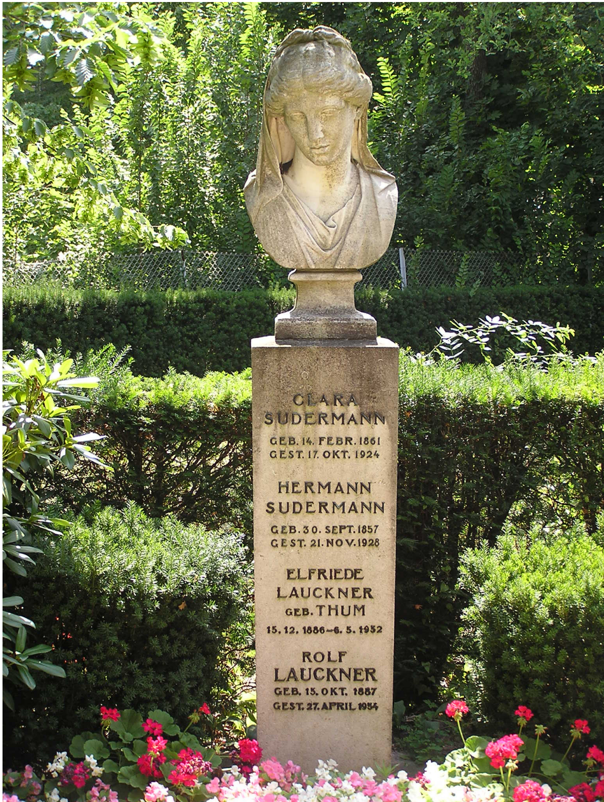
Grab Hermann Sudermanns