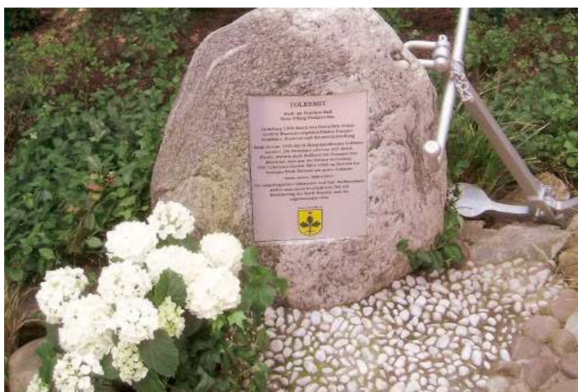
Kaldenkirchen ist ein Stadtteil von Nettetal im Kreis Viersen in Nordrhein-Westfalen .

2002 wurde der Tolkemit-Gedenkstein errichtet; etwa 600 Heimatvertriebene aus Tolkemit fanden 1946 in der Grenzstadt Nettetal ein neues Zuhause. Foto zeigt den Tolkemiter Stein in Nettetal-Kaldenkirchen