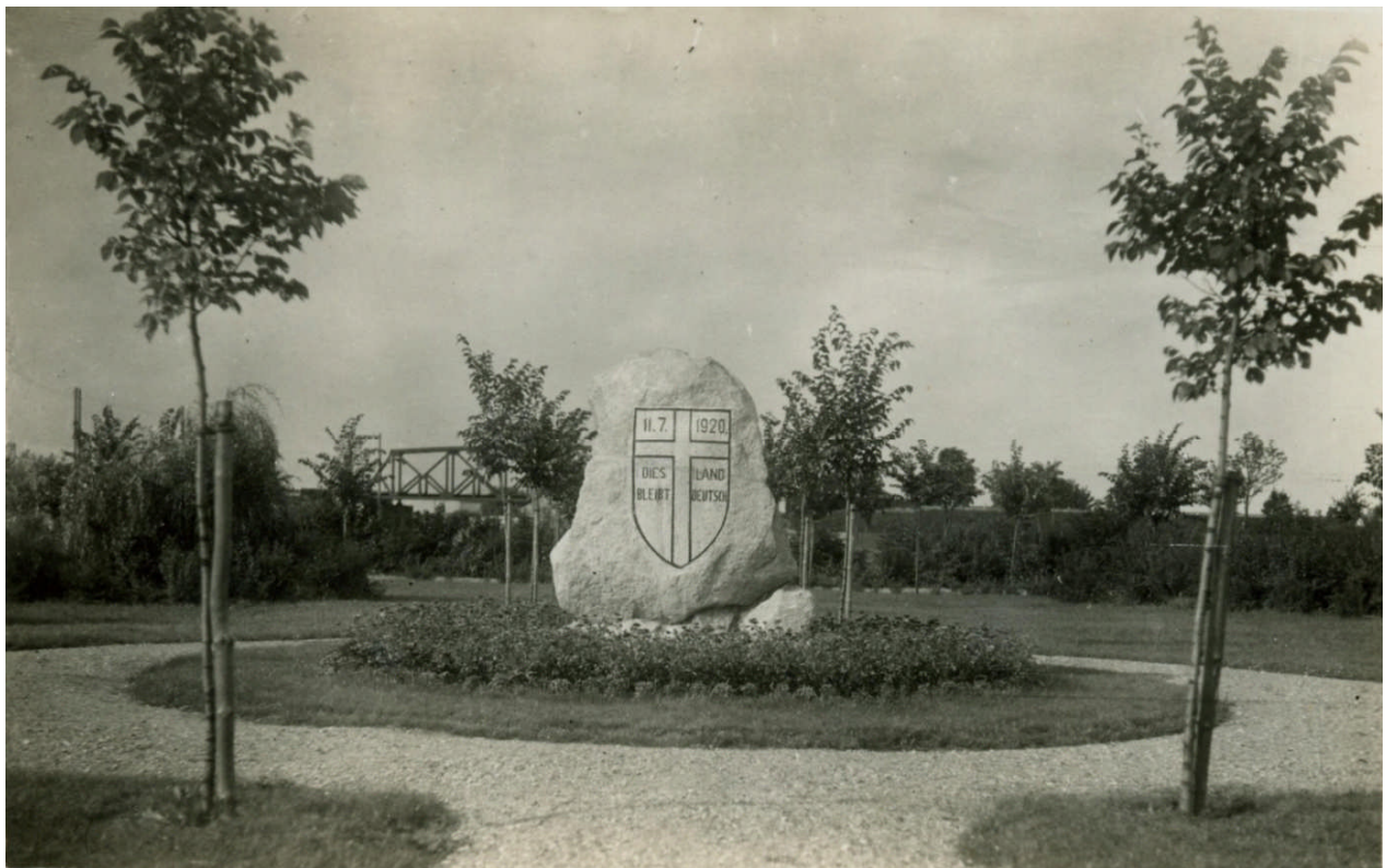
Abstimmungsstein 1930 - Johannsburg

Das Land, da du geboren, das du als Heimat liebst, es ist dir erst verloren, wenn du's verloren gibst.